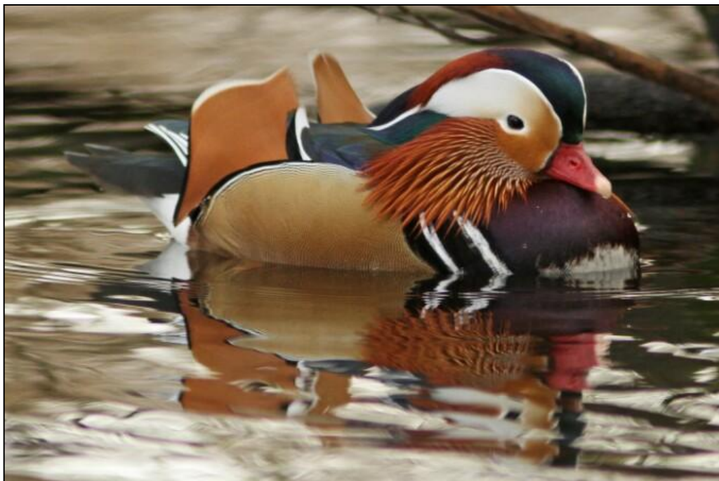
Foto 1: 26.12.2015, Mandarinerpel, Lüneburg, Schierbrunnenteich

Mandarinenten sind im Landkreis Lüneburg unregelmäßige Gastvögel. Bisher wurden ausschließlich Einzeltiere auf dem Lüneburger Schierbrunnenteich, an der Ilmenau zwischen Lüneburg und der Schleuse Bardowick und am Elbufer bei Artlenburg beobachtet. Vermutlich handelt es sich überwiegend um Gefangenschaftsflüchtlinge.