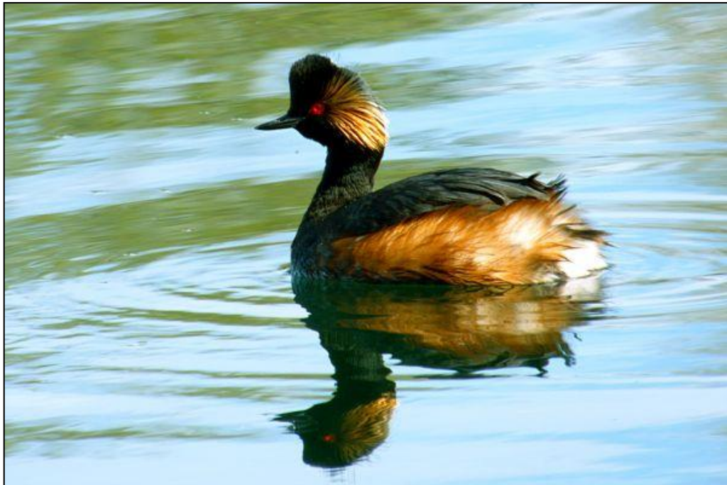
Foto 1: 12.04.2014, Schwarzhalstaucher, Lüneburg, Kreidebergsee