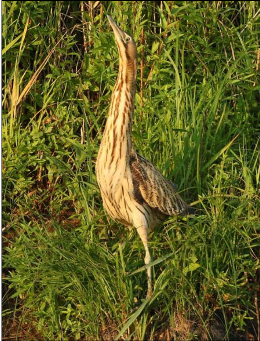
Foto 1: 22.08.2015, Rohrdommel, Bleckede, Radegaster Haken