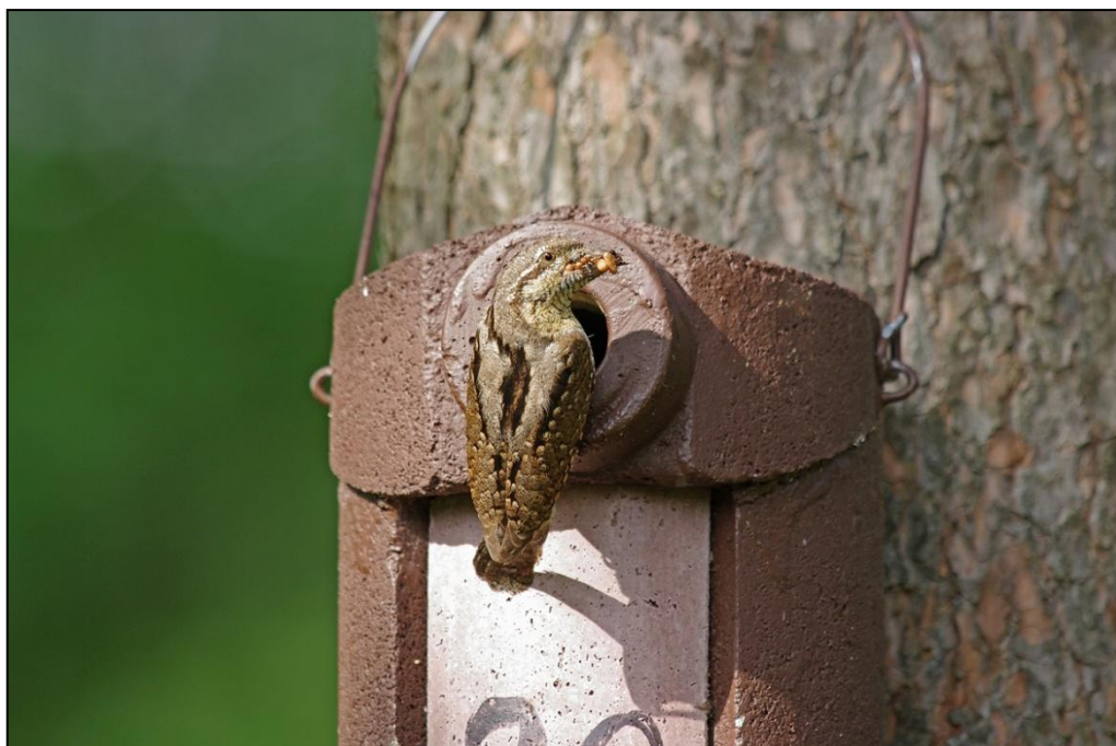
Foto 1: Mai/Juni 2011, Wendehals, Kiesgruben Nindorf-Breetze, Helmut Schneider

Der Wendehals ist im Landkreis Lüneburg Brut- und Zugvogel und kommt von Mitte April bis Anfang September vor. Die Beobachtungen aus dem April und der ersten Maihälfte betreffen möglicherweise Durchzügler.