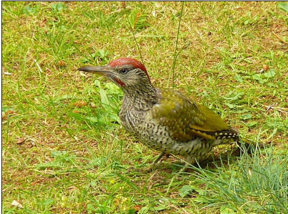
Foto 1: 31.07.2015, Grünspecht juv., Alt Garge