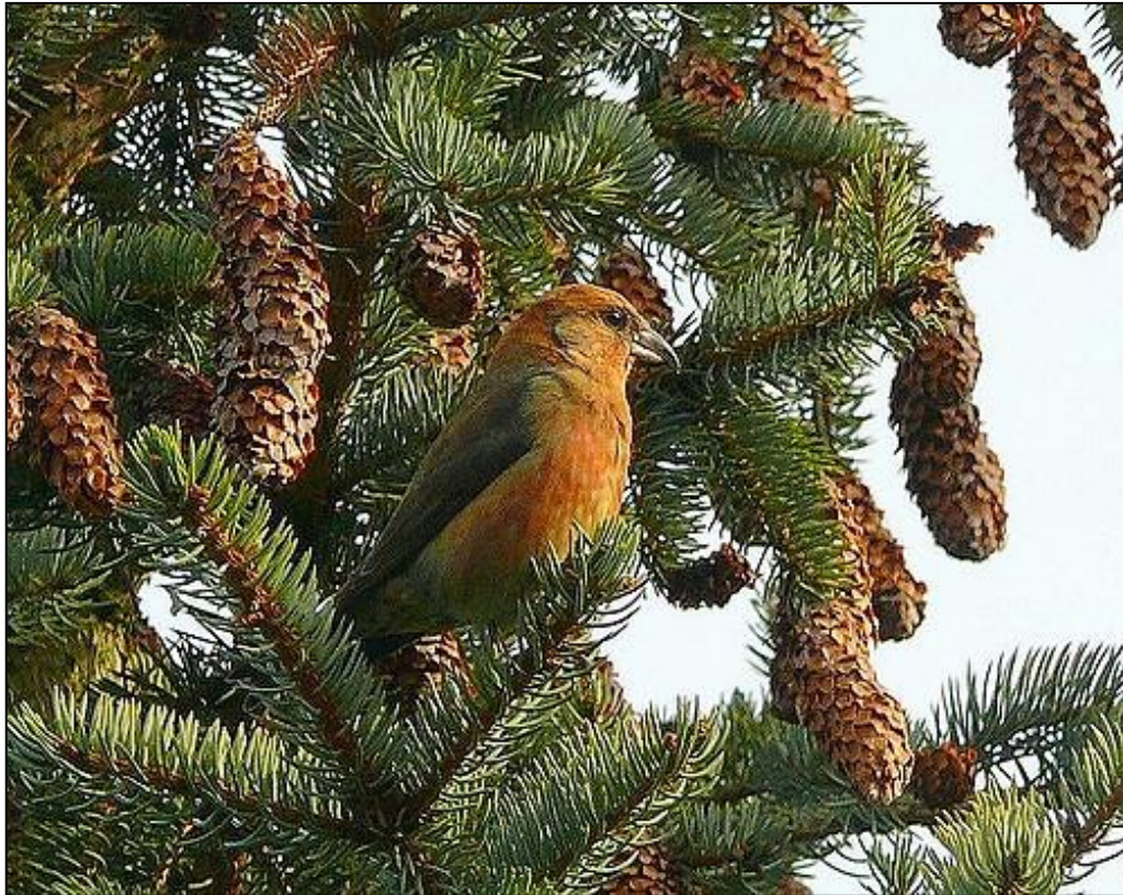
Foto 1: 31.10.2009, Fichtenkreuzschnabel, Bleckede, Alt Garge