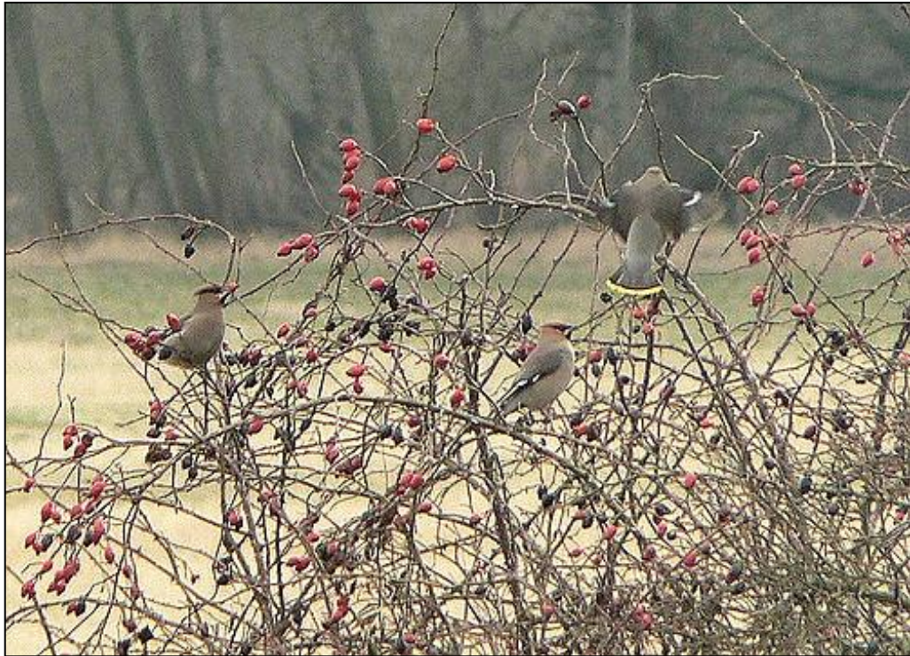
Foto 1: 08.02.2009, Seidenschwanz, Alt Garge