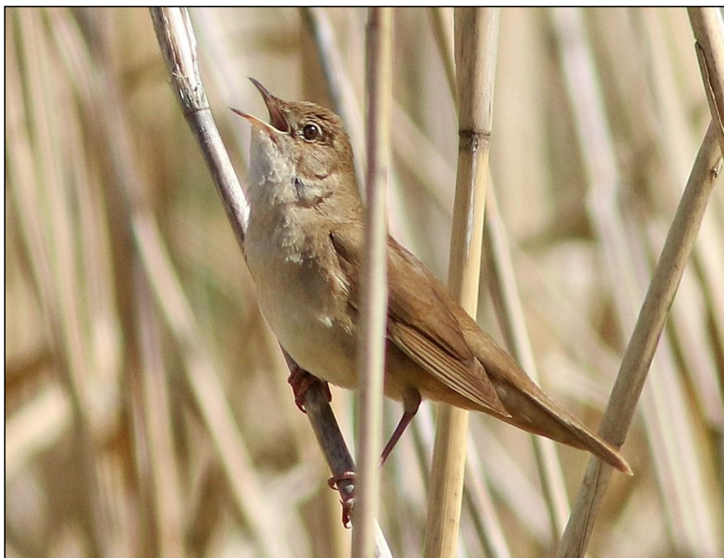
Foto 1: 04.05.2016, Rohrschwirl, Fehlingsbleck