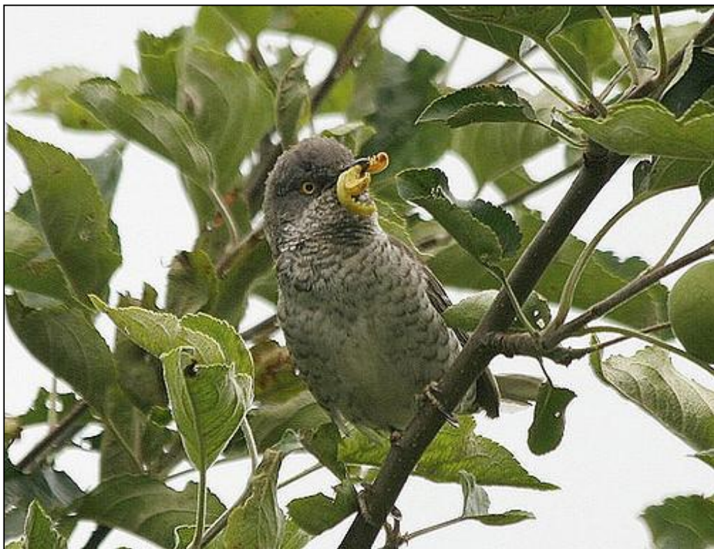
Foto 1: 28.06.2009, Sperbergrasmücke, Bleckede, Alt Garge

Der Schwerpunkt der Verbreitung liegt rechtseibisch im Amt Neuhaus im Elbetal und in der Sude-Niederung sowie linkselbisch zwischen Alt Wendischthun und Alt Garge und im Bereich der Kiesgruben Breetze-Nindorf.