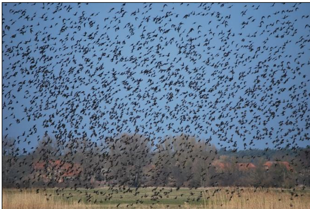
Foto 1: 11.03.2014, Starenschwarm, Wilkenstorfer Teiche, Amt Neuhaus

Kleinere und größere Schlafplätze gab es in folgenden Röhrichtbeständen: Sude bei Preten, Bodenentnahme Schleusenow, Brackeder Stau, Radegaster Haken, Habekost bei Garlstorf, Bauersee bei Alt Wendischthun, NSG Wittsaal bei Radbruch, Stripelsee bei Hohnstorf, Ilmenauwiesen, Kreidebergsee Lüneburg, Ochtmisser Teiche und Schnellenberger Teich.