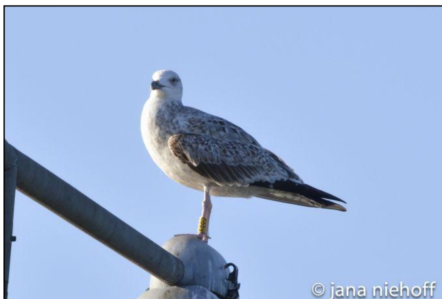
Foto: 19.01.2019, Silbermöwe immat. mit Farbring, ESK bei Scharnebeck, (Auszug aus dem vogelkundlichen Jahresbericht Landkreis Lüneburg 2008-2016)