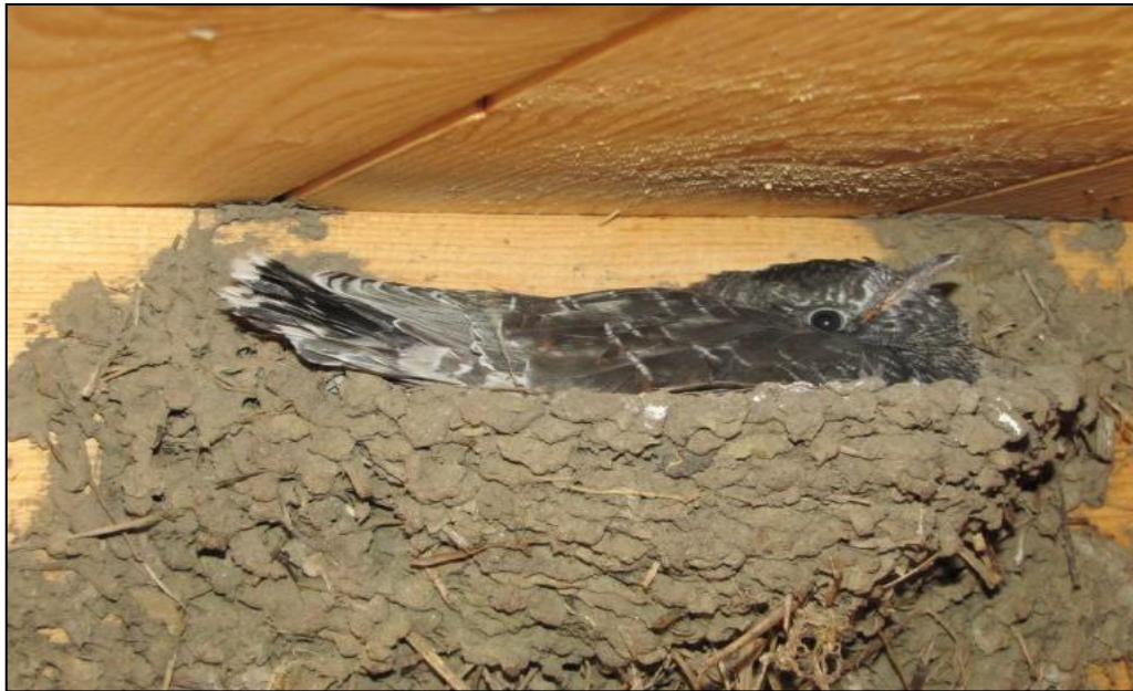
Foto 1: 28.06.2011, Kuckuck, Pullus, Rosien, Kiekut

Der Kuckuck ist Zugvogel und kommt von Anfang April bis Mitte September im Landkreis Lüneburg vor. 21 mal wurde auch die seltenere rotbraune Morphe des Kuckuckweibchens beobachtet.